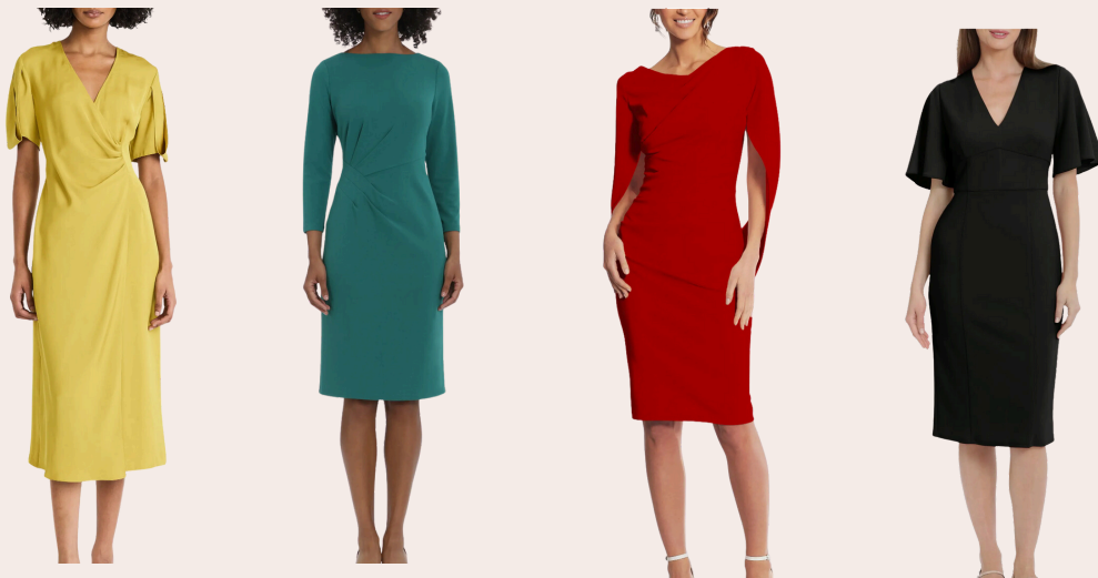
Con Estilo Sin Esfuerzo: Vestidos que son un Placer de Accesorizar